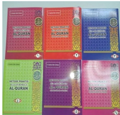
Gambar 1. Buku Panduan Metode Qiroati

Penerapan metode membaca Al-Qur'an yang diterapkan disekolah SDIT Al-Muhajirin adalah metode qiroati, dengan menggunakan panduan buku yang terdiri dari 6 Jilid yaitu jilid 1, 2, 3, 4, 5, dan 6. Berikut gambaran dari buku panduan jilid 1 sampai 6 sebagaimana yang telah tertera pada Gambar 1.